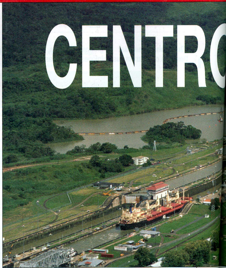
El Canal de Panamá

Unidos hasta 1999. Hoy día, más de 12.000 buques 5 pasan cada año de un océano a otro a través del canal.